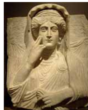
Busto di una aristocratica palmirena (III sec d.C.)

Nota importante: Le iscrizioni al viaggio chiuderanno tassativamente il 1 marzo 2009. Iscrizioni al numero 011642176 , al cellulare 3398530586 o via mail a box@schliemann-carter.org